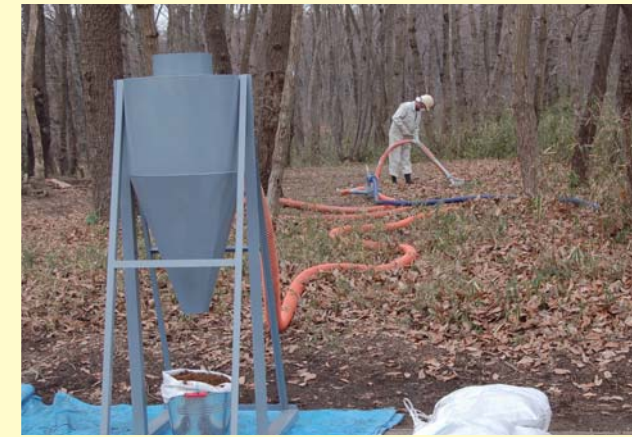
シードバンクスイーパーによる 表土シードバンク採取工