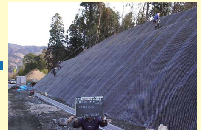
緑化基礎工（金網張工）