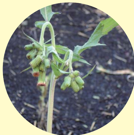
ベニバナボロギク